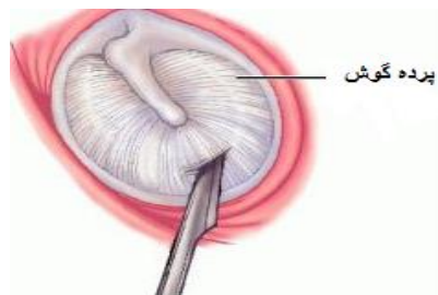
تصویر ۱: ایجاد سوراخ در پرده گوش با چاقوی جراحی مخصوص